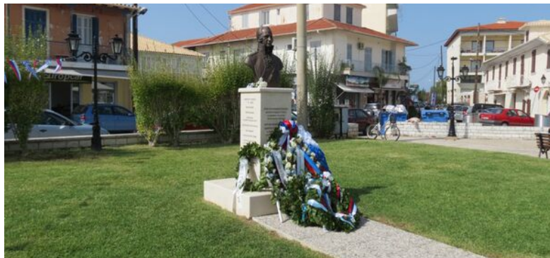
Памятник адмиралу Федору Ушакову на острове Лefкос Греция

Русская эскадра под руководством Ушакова освободила в 1799 году Ионические острова от французской оккупации. Затем адмирал восстановил на острове православный епископат, который пятьсот лет отсутствовал здесь. Примечательно, что именно при Ушакове на Ионических островах было создано первое, после Византийской империи греческое государство.