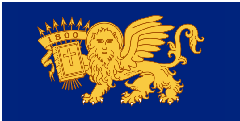
Флаг Республики Семи Соединённых Островов

Проведение этого яхтенного ралли - лучший способ почтить память святого праведного воина и выдающегося русского флотоводца Фёдора Ушакова, жившего в российском Севастополе, и сражавшегося за нашу Родину во времена величия парусного флота России!