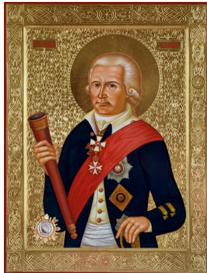
Икона «Севастопольская» Святого праведного воина Феодора Ушакова

Яхтенное ралли стартует от стен древнего Херсонеса и посвящается выдающимся победам российского адмирала Феодора Ушакова на Ионических островах. Протяжённость ралли – 1000 морских миль. В ралли примут участие моторные яхты и на конечном участке маршрута - от Коринфского канала и до острова Корфу, к моторным яхтам присоединятся парусные яхты.