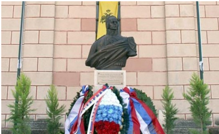
Памятник адмиралу Федору Ушакову на острове Закинф Греция