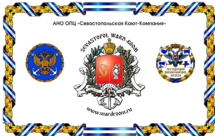
Эмблема Севастопольской Кают-Компании